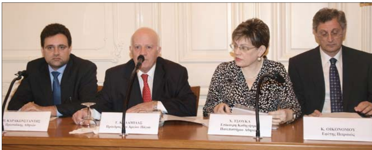
Ο Πρόεδρος του Αρείου Πάγου και ομιλητές της εκδήλωσης

Στις 10 Δεκεμβρίου 2009 πραγματοποιήθηκε στην αίθουσα εκδηλώσεων του Δικηγορικού Συλλόγου Πειραιά η εκδήλωση για την Ευρωπαϊκή Ημέρα Πολιτικής Δικαιοσύνης.