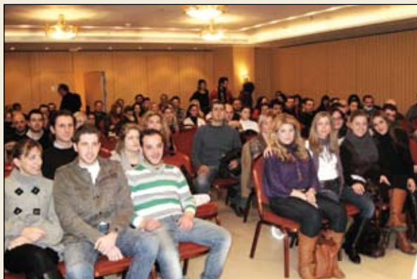
Από την παρακολούθηση των σεμιναρίων των Ασκουμένων Δικαστικών Επιμελητών

ΕΦΕΤΕΙΩΝ ΑΘΗΝΩΝ- ΠΕΙΡΑΙΩΣ- ΑΙΓΑΙΟΥ- ΔΩΔΕΚΑΝΗΣΟΥ ΚΑΙ ΛΑΜΙΑΣ