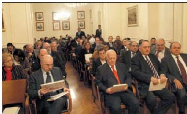
Ο Εισαγγελέας του Αρείου Πάγου, ο Πρόεδρος του Ελεγκτικού Συνεδρίου και άλλοι επίσημοι στην εκδήλωση

Συντονιστής της εκδήλωσης ήταν ο Πρόεδρος του Αρείου Πάγου κ. Γεώργιος Καθαμίδας και χαιρετισμό απηύθυναν ο Πρόεδρος του Δικηγορικού Συλλόγου Πειραιά κ. Στέλιος Μανουσάκης καθώς και ο Εισαγγελέας του Αρείου Πάγου κ. Τέντες.