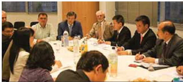
Από τα γραφεία της ΟΔΕΕ με τους Βιετναμέζους Δικαστικούς Επιμελητές

Στις αρχές Οκτωβρίου ο Πρόεδρος Διονύσης Κριάρης και μέλη της Εκτελεστικής Γραμματείας υποδεχτήκαμε στα γραφεία μας πολυμελή αντιπροσωπεία νομικών, με επικεφαλής τον Υφυπουργό Δικαιοσύνης του Βιετνάμ κ. Nguyen Duc Chinh.