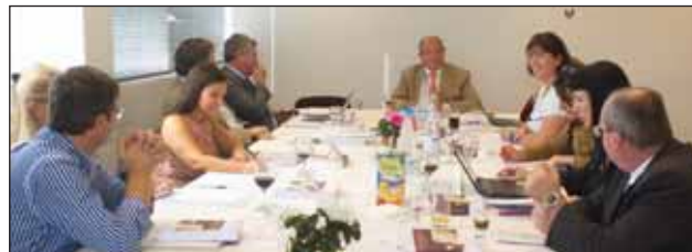
Η Επιστημονική Ομάδα της Διεθνούς Ένωσης στα γραφεία της ΟΔΕΕ

τίμησαν με την παρουσία τους, πως η εμπλοκή - παρεμβολή του δικαστικού επιμελητή σε ορισμένες μορφές απόδειξης θα καταστήσουν την απονομή της δικαιοσύνης στις Αστικές και Εμπορικές υποθέσεις όχι μόνο ασφαλέστερη και ταχύτερη αλλά και σημαντικά πιο αξιόπιστη. Επίσης, έγινε, πιστεύουμε, αντιληπτό πόσο θα μειωθεί το κόστος από πλευράς της Πολιτείας από την απεμπλοκή μιας σειράς υπαλλήλων που ασχολούνται για τη διεκπεραίωση όλων των αυτών των υποθέσεων.