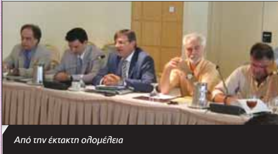
Από την έκτακτη ολομέλεια