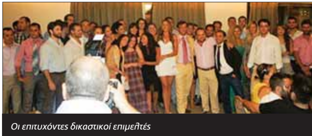
Οι επιτυχόντες δικαστικοί επιμελητές

Ολοκληρώθηκαν με επιτυχία τα ετήσια σεμινάρια των επιτυχόντων δικαστικών επιμελητών και όπως κάθε χρόνο πραγματοποιήθηκε, προς τιμή τους, εκδήλωση απονομής σε ξενοδοχείο της Αθήνας.