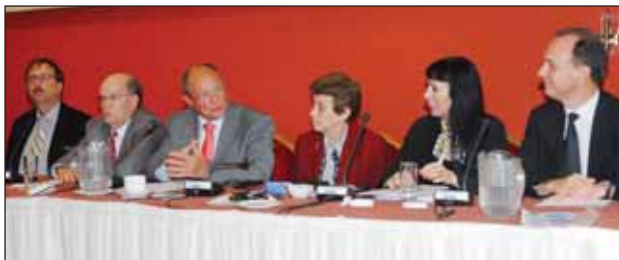
Η Επιστημονική Ομάδα της Διεθνούς Ένωσης

Πραγματοποιήθηκε στην Αθήνα στις 7 Οκτωβρίου 2011 η Επιστημονική ημερίδα της Διεθνούς Ένωσης Δικαστικών Επιμελητών σε συνδιοργάνωση με την ΟΔΕΕ και με θέμα εργασίας: «Ο Δικαστικός Επιμελητής στη διαδικασία της Δικαστηριακής Απόδειξης». Ένα αντικείμενο που αποτελεί τη βάση στη δίκαιη δίκη και στην απονομή της δικαιοσύνης, κυρίως και αυτό αναλύθηκε στην Πολιτική Δίκη. Εκεί, όπου ο δημόσιος, ανεξάρτητος δημόσιος λειτουργός, παίζει σημαντικό ρόλο σε αρκετές χώρες της Ευρώπης και που ευελπιστούμε κάποια μέρα να αντιληφθούν και οι νομοθετούντες στη χώρα μας.