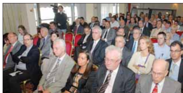
Άποψη από την γεμάτη αίθουσα του ξενοδοχείου TITANIA