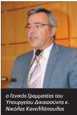
ο Γενικός Γραμματέας του Υπουργείου Δικαιοσύνης κ. Νικόλαος Κανελλόπουλος

Ολοκληρώθηκαν με επιτυχία τα ετήσια σεμινάρια των επιτυχόντων δικαστικών επιμελητών και όπως κάθε χρόνο πραγματοποιήθηκε, προς τιμή τους, εκδήλωση απονομής σε ξενοδοχείο της Αθήνας.