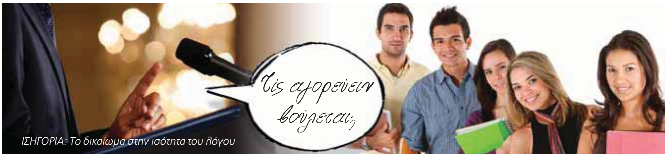
ΙΣΗΓΟΡΙΑ: Το δικαίωμα στην ισότητα του λόγου